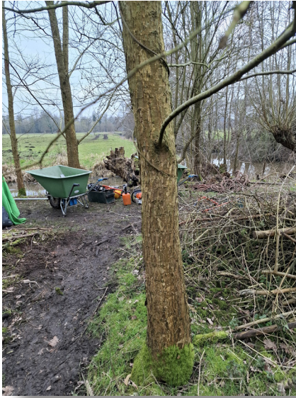
Fladderiep op Queekhoven

iep veelal aan deze ziekte. De fladderiep is waardplant voor enkele vlindersoorten, onder meer de grote vos, de iepenpage en gehakkelde aurelia.