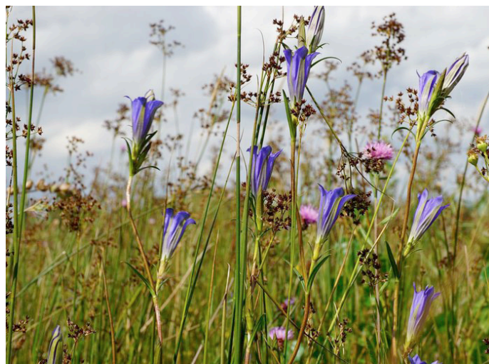
Grasland met klokjesgentiaan

Staatsbosbeheer maait daarom in mei alleen in eenvormige, soortenarme graslanden. Juist om deze om te vormen naar gevarieerde en bloemrijke graslanden. Marcel: “Hierbij houden we natuurlijk rekening met de aanwezige natuurwaarden. Daarnaast is er voorzichtigheid geboden in verband met weidevogels en jonge dieren, zoals reekalfjes. De te maaien graslanden worden dan ook eerst gecheckt door de boswachter. Als daar aanleiding toe is, passen we de maaiplannen aan.”