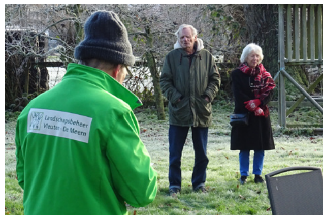
Uitreiking Gouden Hiep op 09-01-2021