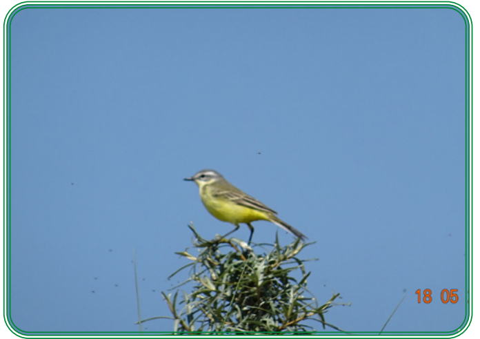
Meer foto's kun je zien door hier te klikken