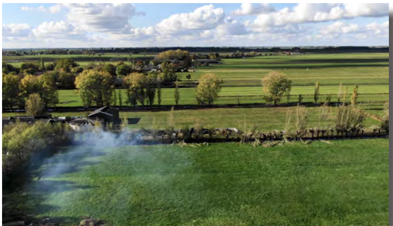
Een impressie vanuit de lucht van de polder Rijnenburg

De gemeente Utrecht heeft vier partijen geselecteerd die hun plannen voor het opwekken van energie in de polders Rijnenburg en Reijerscop verder mogen uitwerken. Dat plan gaat nu uit van drie windmolens en zeven hectare aan zonnenveld. Dat zijn minder windmolens dan de acht die er volgens de gemeente mogelijk zijn.