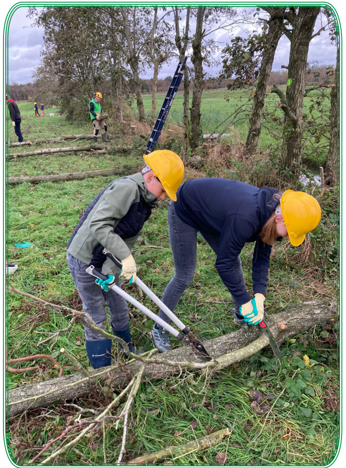
Deze foto's van de Natuurwerkdag zijn deels van Hans den Hartog