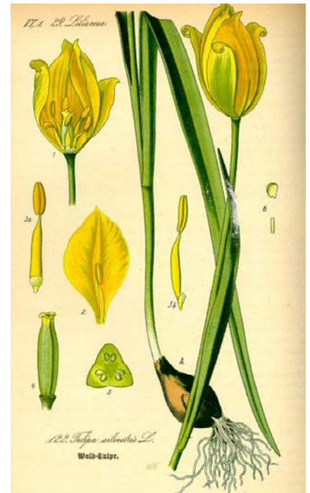
Bostulp (bron: Flora von Deutschland, Österreich und der Schweiz (1885), Otto Wilhelm Thomé)

Dit artikel en de foto's komen van de website van Nature Today.nl.