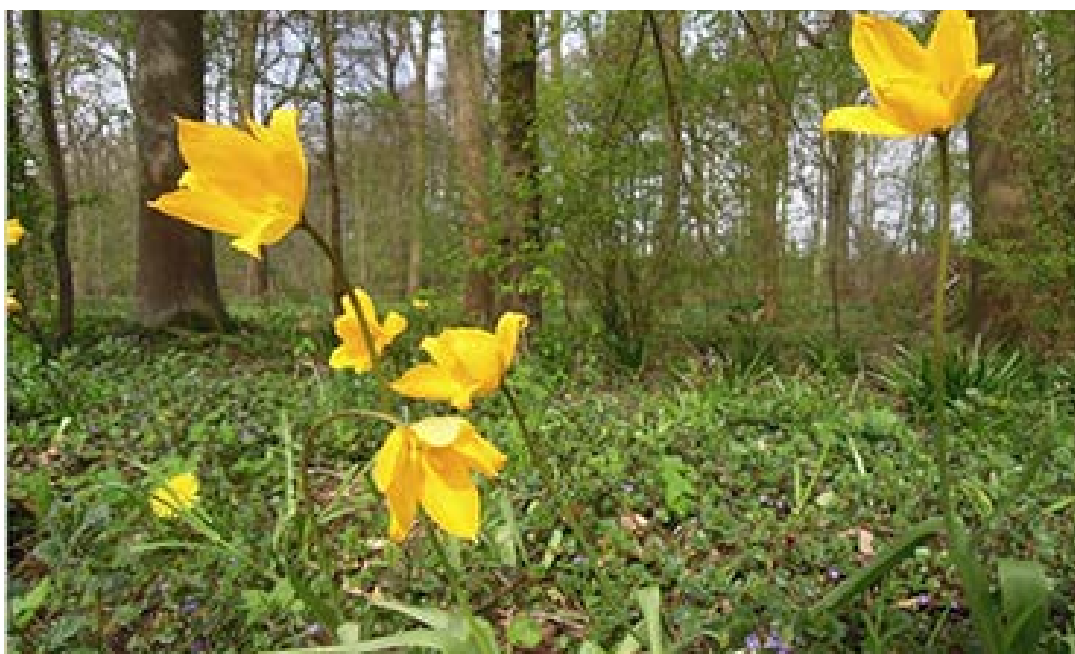
Bostulp in Hortus Nijmegen