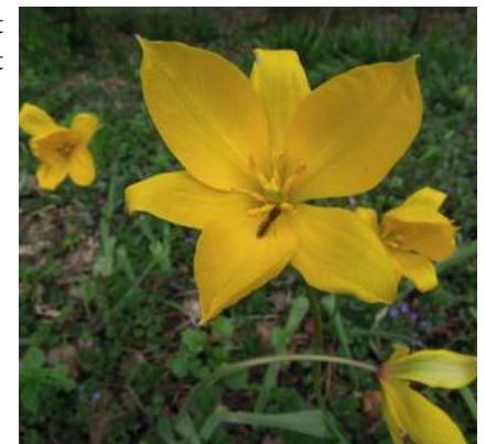
Slanke driehoekszweefvlieg op bostulp in Hortus Nijmegen